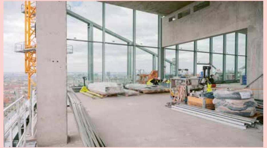
Blick von der Baustelle View from the construction site