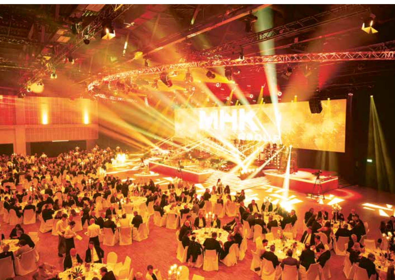
Rund 2000 Gäste erlebten im Rahmen der MHK Hauptversammlung einen glanzvollen Gala-Abend in unserem Haus. Around 2000 guests enjoyed a glamorous gala evening at the Estrel Convention Hall as part of the MHK Annual General Meeting.