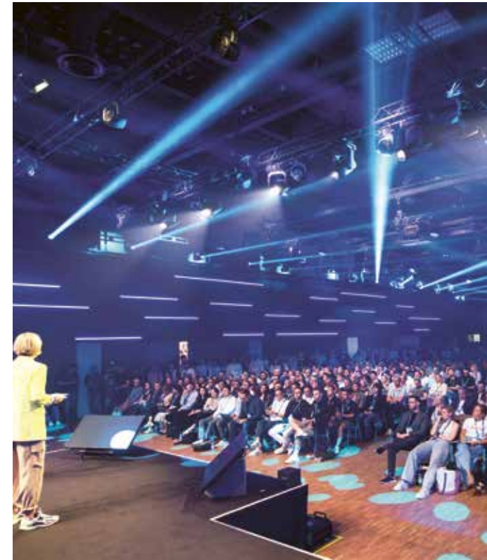
Die The K5 – Future Retail Conference , das Gipfeltreffen der Handelsszene, findet seit 2017 im Estrel statt. 2500 Teilnehmende waren 2025 dabei. The summit meeting of the retail scene, has been held at the Estrel since 2017. 2,500 participants attended in 2025.