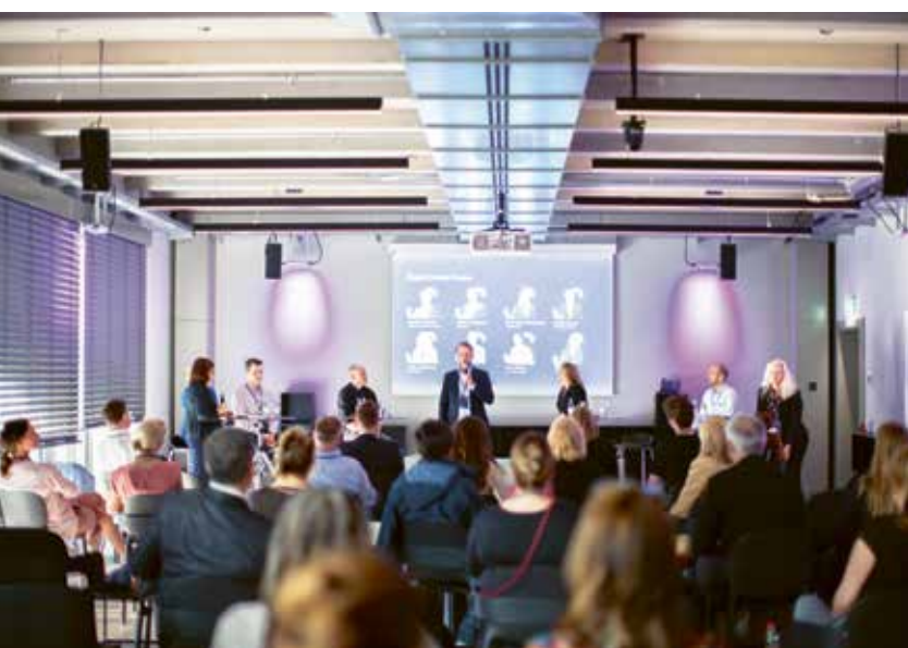
Smart connect 2025 – Das Netzwerktreffen brachte 60 Teilnehmende aus nationalen Verbänden zusammen. The networking event brought together 60 participants from national associations.

Im vergangenen Jahr zum ersten Mal im Estrel, nun steht die Wiederholung an: Wir freuen uns sehr, auch in diesem Jahr DAS Leitevent der Logistikbranche, die BVL Supply Chain für rund 2500 Teilnehmende ausrichten zu dürfen. Ein weiteres Highlight im Estrel-Veranstaltungskalender war der diesjährige erstmals durchgeführte „Kongress für Prävention und Langlebigkeit“ der Gesundheitsstadt Berlin, der auch im kommenden Jahr wieder in unserem Haus tagen wird. Die vergangenen Monate zeigten wieder die enorme Bandbreite des Estrel. Für Kunden wie z.B. K5, MLP Finanzberatung SE, Thermo Fisher Scientific oder die Schornsteinfegerinnung zog unser Team alle Register, um die Gäste mit maßgeschneiderten Veranstaltungslösungen und unserem herausragenden Service zu begeistern. Im Bereich der Veranstaltungstechnik sind die modularen aufblasbaren Quickspace, die u.a. bereits für ING CISO zum Einsatz kamen, neu im Haus verfügbar, ebenso wie eine Auswahl an brillanten LED-Säulen für Ihr individuelles Event-Leitsystem.