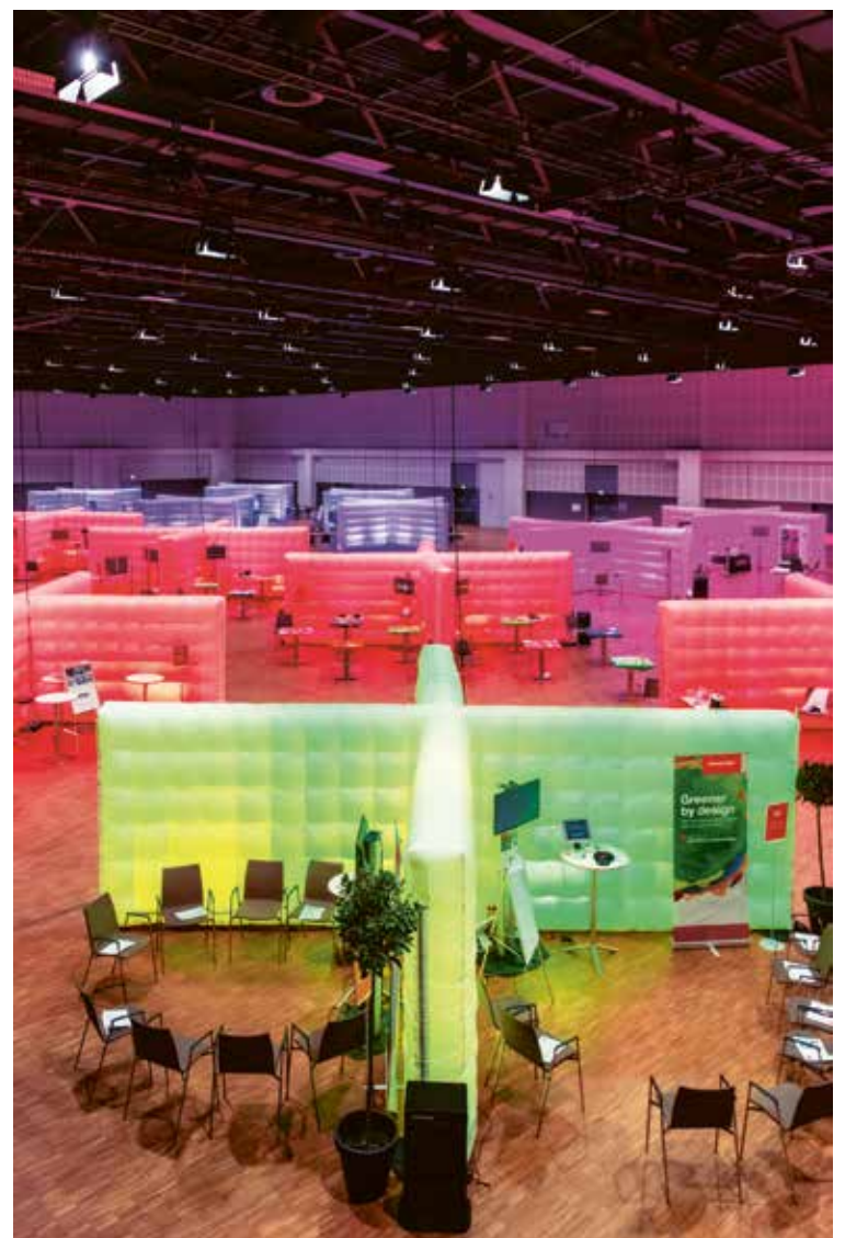
Thermo Fisher Scientific , weltweit erfolgreich in der Life-Science-Branche, tagte in diesem Jahr erneut mit 1100 Teilnehmenden in unserem Haus a globally successful company in the life sciences industry, met again this year at our venue with 1,100 participants.

We're also excited to share some new additions to our inventory of in-house technology. This year, we partnered with QuickSpaces to offer inflatable, modular space solutions. These proved hugely successful at the ING CISO conference, among other events. We've also added a new selection of LED columns to our portfolio – ideal for creating bespoke lighting concepts and ambiance.