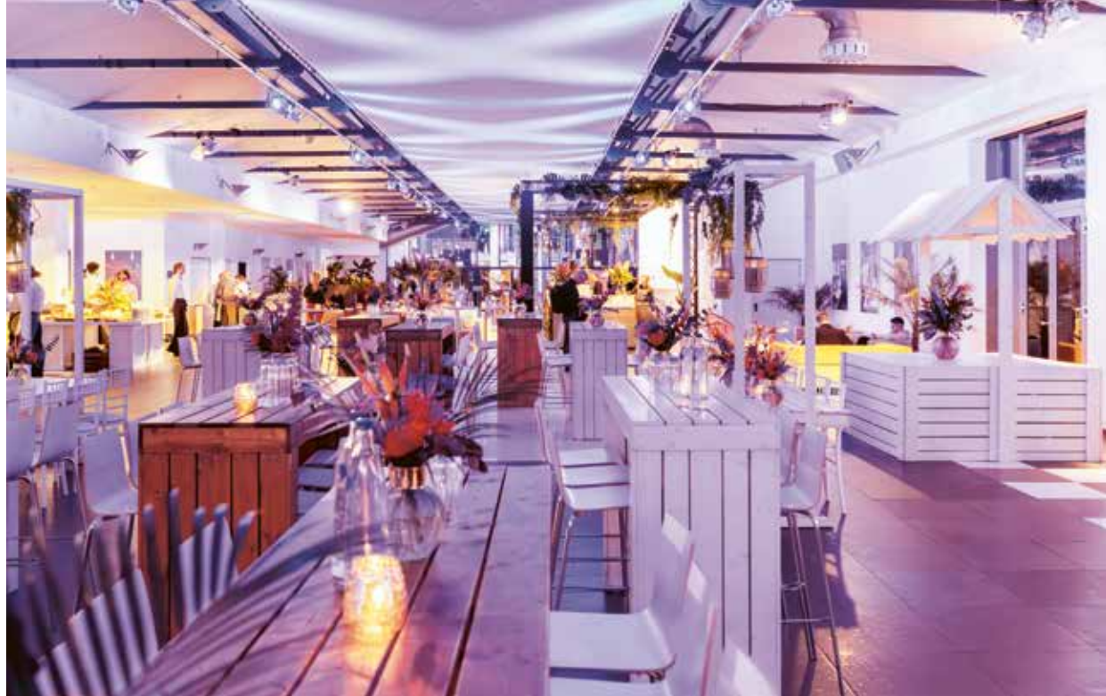
MLP Finanzberatung SE , seit 25 Jahren Stammkunden im Estrel, waren mit 2600 Teilnehmenden vor Ort a regular customer at the Estrel for 25 years, was there with 2,600 participants.

Following its successful Estrel debut last year, we're delighted to welcome back the annual BVL Supply Chain CX in October 2025. Around 2,500 visitors are expected to attend this leading logistics convention and expo.