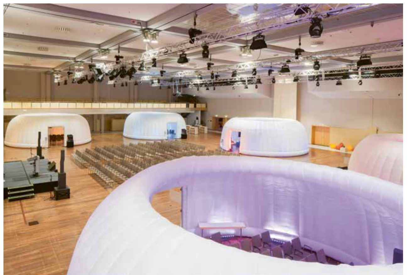
ING CISO 2025 , die IT-Fachkonferenz fand mit 300 Teilnehmenden im Estrel statt the IT conference, took place at the Estrel with 300 participants.